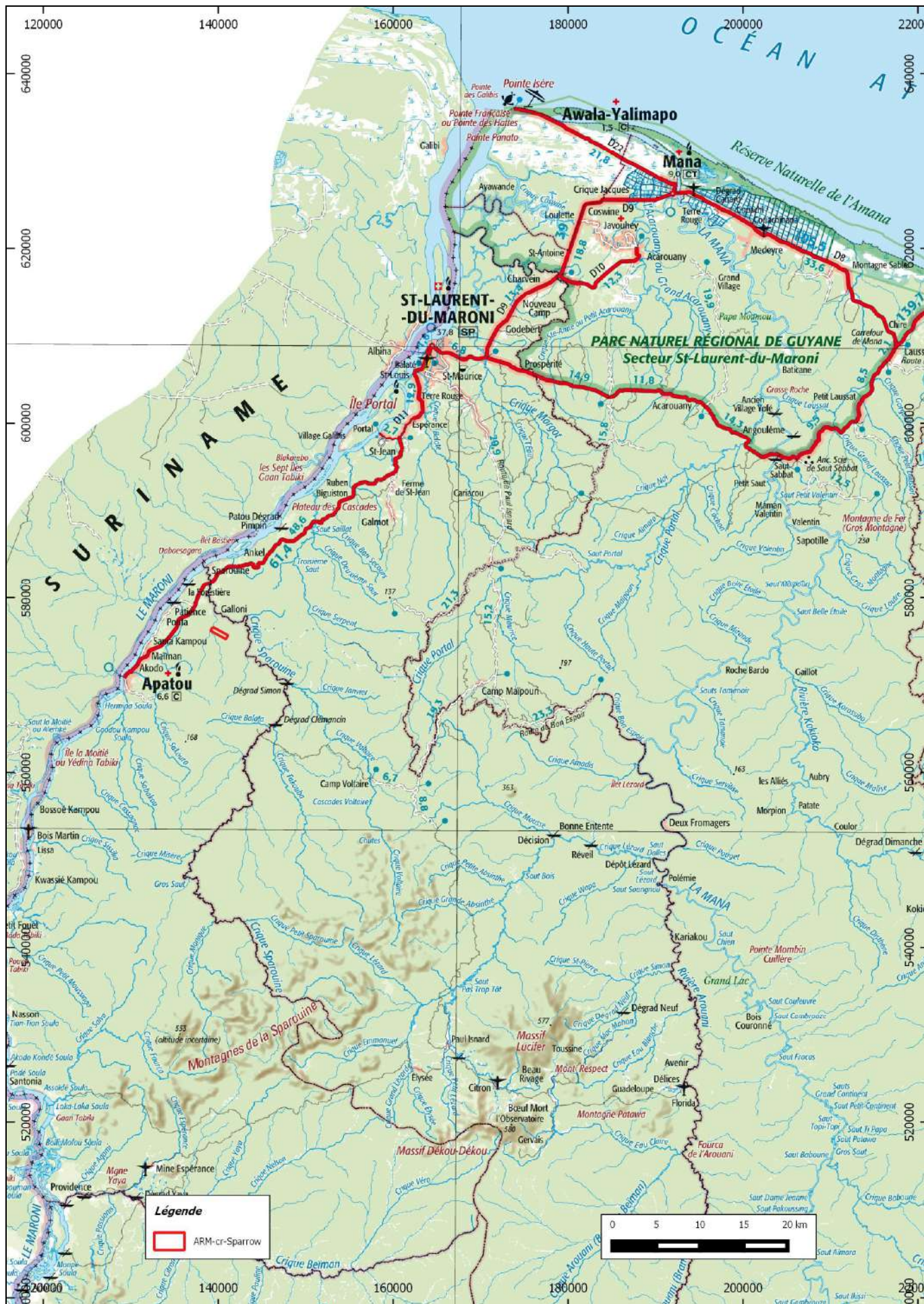
Carte de localisation de l'ARM crique Sparrow d'un km 2 , SASU GTP, d'après la carte IGN au 1/500 000 e en RGFG95 UTM22